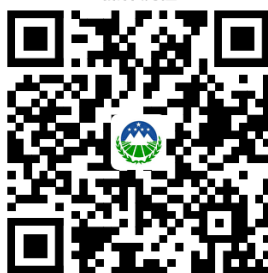
13.矿产资源储量评审备案