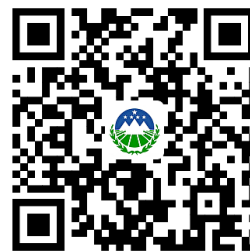
自然资源权力事项清单