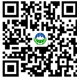
2.建设用地（含临时用地）规划许可证