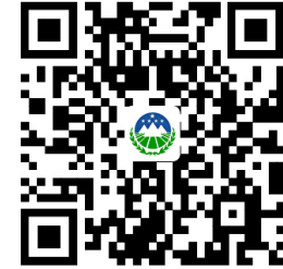
容缺受理事项清单